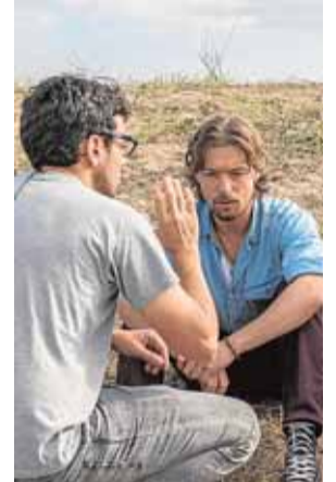
Rodaje de 'El desentierro'.